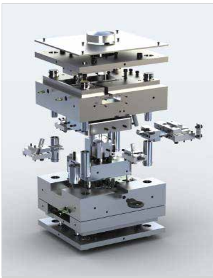
Эта основа пресс-формы была разработана с помощью PTC Creo Expert Moldbase Extension с выполнением рендеринга в PTC Creo Parametric™.