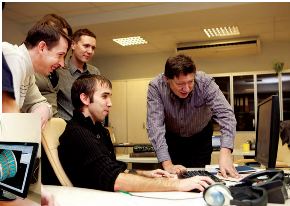
В инженерной деятельности компании внедрен процессный подход (Windchill PDM Link и MPM Link) и проектное управление (Windchill Project Link) с переходом на электронный конструкторский, технологический и управленческий документооборот

Индустриальная группа УПЭК развивается как инженерная клиентоориентированная компания. В целях IT-переоснащения предприятий в ноябре 2008 года стартовал проект КСА-2008. Сегодня, спустя полтора года, подводятся итоги этой работы.